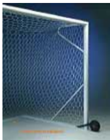
Porte Calcio trasportabili