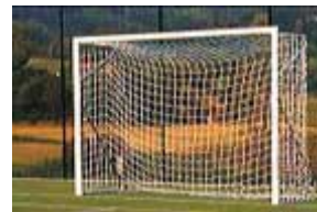
Porte Calcio a 5