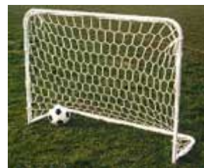
Porte Mini Calcio