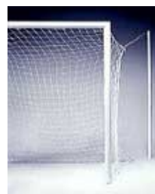
Porte Calcio con Reggirete