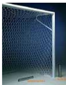
Porte Calcio con Reggirete