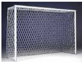
Porte Calcio a 5 in Alluminio