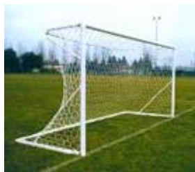
Porte Calcio Trasportabili m 4x2