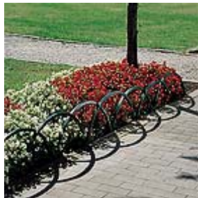
Iris cod. 24 0010