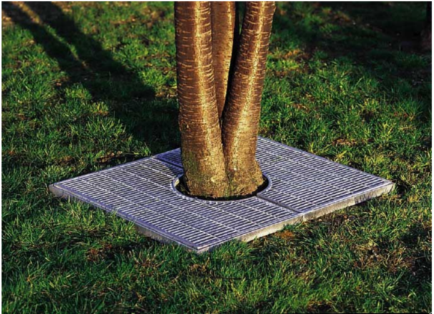
Art. 37 0110 - Salvapiante modello Diana - Scheda Tecnica Descrittiva