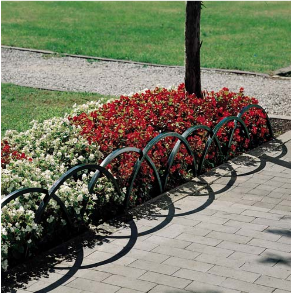
Art. 24 0010 - Salvapiante modello Iris

AGORA' si riserva, in qualsiasi momento, di apportare le modifiche ritenute opportune per il miglioramento dei propri articoli.