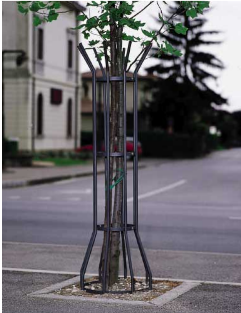
Art. 97 0011 - Salvapiante modello Sicuro - Scheda Tecnica Descrittiva