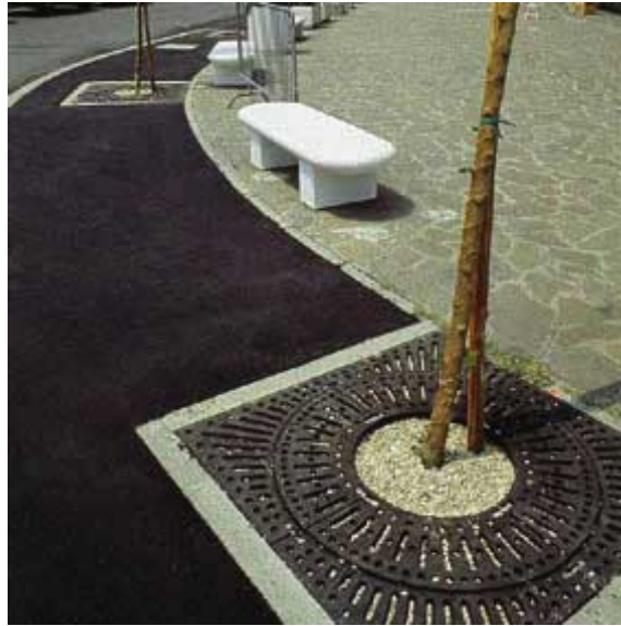
Griglie protezione Alberi

AGORA' si riserva, in qualsiasi momento, di apportare le modifiche ritenute opportune per il miglioramento dei propri articoli.