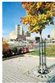
Griglie per Alberi