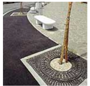
Griglie protezione Alberi